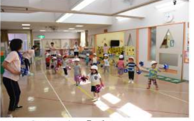
さくら組「ガオー！」みんな大好きジュウオウジャー