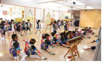
ゆり・ばら組「タキオズソーラン2」は掛け声も勇ましく…

9月3日(土)は待ちに待った大運動会。かけっこやおゆうぎ、親子競技、鼓笛演奏など盛りだくさん。ご来場のみなさんも運動しやすい服装でご参加下さい。ご家族で、地域のみなさんも一緒に、スポーツの秋を楽しみましょう！手拍子とご声援、よろしくお願いします！