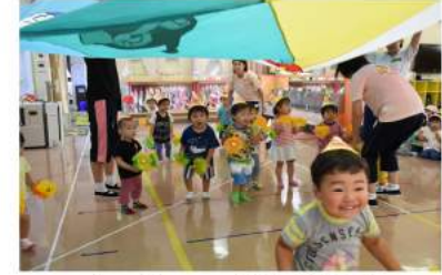
すみれ・ひまわり組はサンバのリズムで…♪