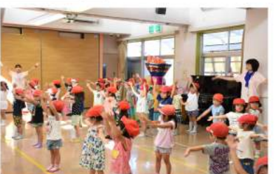
準備体操「EXダンス体操」運動会スタート、レッツゴー！