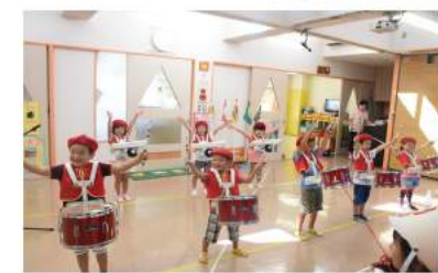
ゆり組は最後の運動会心をあわせて「聖者の行進」

園の玄関は朝9時から夕方まで施錠しています。遅刻や早退の際は、インターホンやマイクでお知らせ下さい。