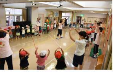
最後はみんなでフォークダンス「WAになっておどろう」